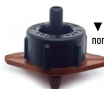
▼ Base marrón caudal nominal 16 l/h