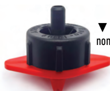
▼ Base roja caudal nominal 8 l/h