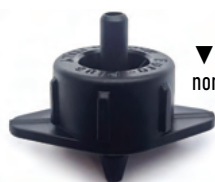
▼ Base negra caudal nominal 4 l/h